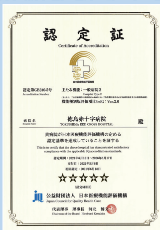
日本医療機能評価機構 3rdG: Ver.2.0

さらに、当院はNPO法人 卒後臨床研修評価機構から当院の研修プログラムや研修状況を評価する認定証の交付を受けています。2021年12月1日には、4回目となる4年間の更新認証もいただき、これを機会に一段とレベルアップした臨床研修病院になれるよう改善に取り組んでいます。