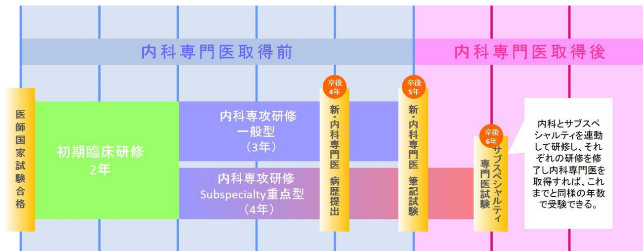
図 1. 徳島赤十字病院内科専門研修プログラム（概念図）

基幹施設である徳島赤十字病院内科で、専門研修（専攻医）1年目、2年目に1.5年間の専門研修を行います。