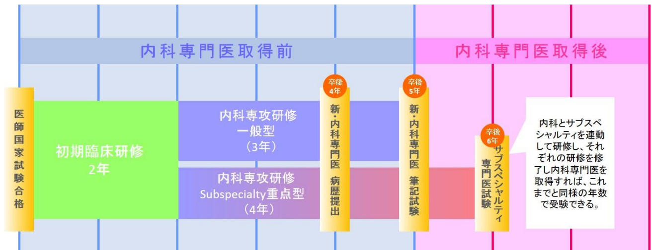
図1. 徳島赤十字病院内科専門研修プログラム（概念図）

基幹施設である徳島赤十字病院内科で、専門研修（専攻医）1年目、2年目に2年間の専門研修を行うのが基本形です。但し、症例経験の進捗状況や Subspecialty 研修の希望に応じ、基幹施設での研修のうち半年間分については、連携施設に按分したり、3年目の後半の基幹施設にあてることも可能とするなど、柔軟に対応します。